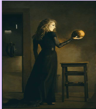
* Imagen: Arturo Rivera, "Hamlet", 1997

-miércoles 3 de agosto/2011 - 21hs.“Camarín de Las Musas” - Mario Bravo 960