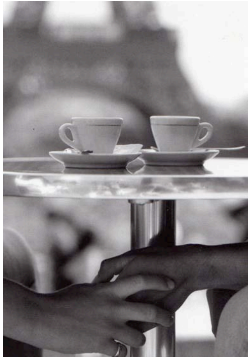
Paris. Amoureux. Sans alcool. En arrière-plan, flou comme il se doit : un phallus.

Étrange expérience que ces deux dernières années de ce séminaire : à lire Lacan de près vous saute au visage que ce que l'on croyait savoir qu'il avait dit, eh bien, ce n'était pas exactement ça, et même...pas ça du tout, ou presque.